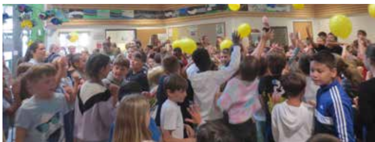
Schulstart im Schulhaus Weid.

Ganz nach dem Jahresmotto «Zusammenspiel» haben wir beim Schuljahresstart alle zusammen gesungen, gelacht, uns über Amor erfreut, über Spielregeln nachgedacht und gespielt. Die 6. Klässler/innen durften gemeinsam mit ihren Gotti- und Göttinkinder der 1. Klasse für die Jüngsten im Weid Seifenblasen voll mit guten Wünschen von den o-