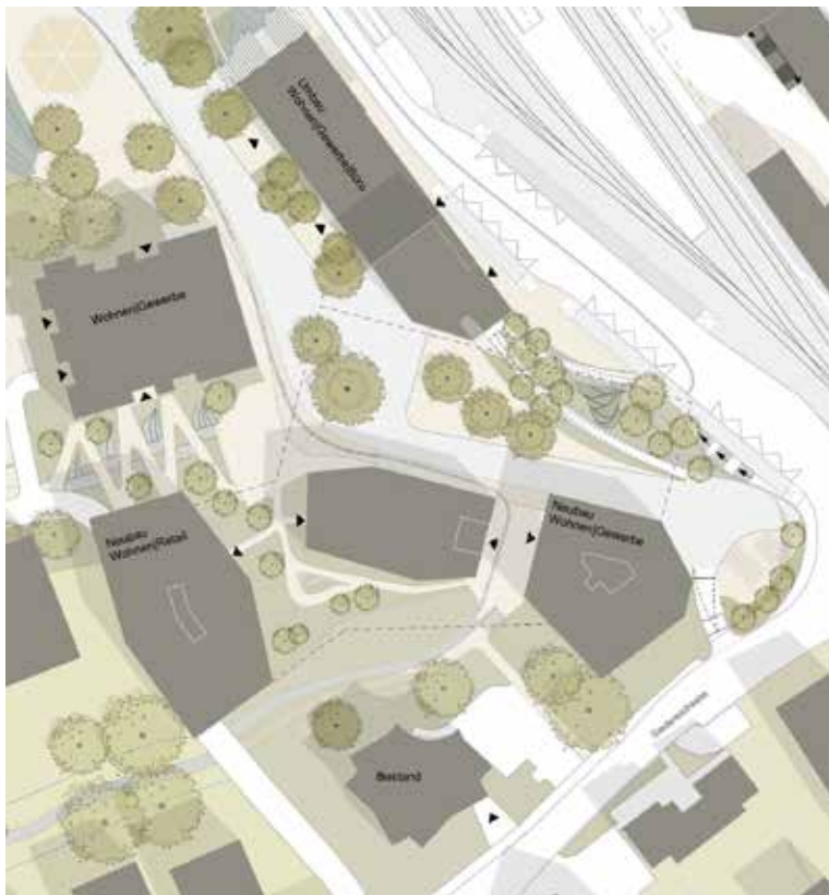
Der überarbeitete Südiplatz aus der Vogelperspektive.

Die Synthesearbeiten für das Südiareal konnten Ende November erfolgreich abgeschlossen werden: Ideen der anderen Teams der Testplanung wurden in das Projekt von Salewski Nater Kretz integriert, die städtebauliche Idee nochmals vertieft und optimiert. Am Grundsatz, die «zitadellenähnliche Bebauung» entlang der Hangkante zu erhalten und mit Neubauten unter anderem entlang eines neuen Südiplatzes zu ergänzen, hat sich nach den sehr positiven Feedbacks der Mitwirkung zur Testplanung nichts geändert. Der Südiplatz soll nach wie vor von einer verbesserten Personenunterführung aus ebenerdig zugänglich werden. Er wurde gemeinsam mit dem Volumen der umliegenden Gebäude überarbeitet. Das nun finalisierte städtebauliche Konzept wird mit den weiteren gewonnenen Erkenntnissen, z.B. im Bereich Mobilität, Etappierung oder Freiraum in einem Masterplan für das Areal