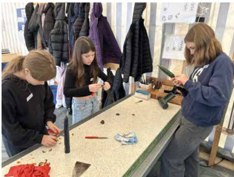
Kerzenverzieren unter Anleitung.

Vom 27. November bis 18. Dezember 2024 lädt das traditionelle Hochdorfer Kerzenziehen zum 33. Mal Gross und Klein ein, eigene Kerzen zu gestalten. Im beheizten Zelt vor dem Bellevue-Center wird ein kreativer Treffpunkt geboten, der die Vorweihnachtszeit mit farbenfrohem Kerzenschein bereichert. Je-