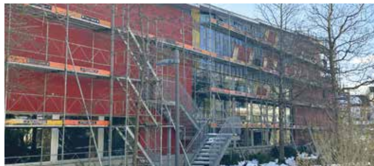
Die Nordseite des Kulturzentrums: eingerüstet und mit teilweise fehlender Eternit-Fassade.

Am Kulturzentrum Braui werden aktuell mehrere Sanierungsarbeiten vorgenommen. Einerseits wird das Flachdach saniert, da es an mehreren Orten nicht mehr dicht und deshalb Wasser eingedrungen ist. Dies auch als Vorbereitung für die PV-Anlage, die in einem späteren Schritt auf dem Dach installiert wird. Andererseits muss die Eternitfassade saniert werden, da die Tragkonstruktion teilweise verfault ist und dadurch die Gefahr herunterfal-