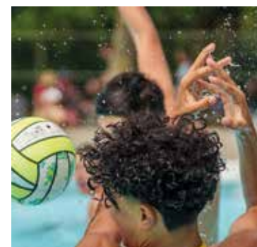
Fertigkeit war beim Wasserball eine Voraussetzung.

Auf dem Rasenplatz hatten sich alle Gruppenchefs neben einer Holztafel, auf dieser stand nämlich die jeweilige Gruppennummer, aufgestellt. Als alle Gruppen komplett waren, durften wir endlich starten. Jede Gruppe musste acht Posten absolvieren. Uns haben alle Posten gefallen, aber das Ratespiel «ABC SRF 3» und der «Eierlauf» haben uns am besten gefallen.