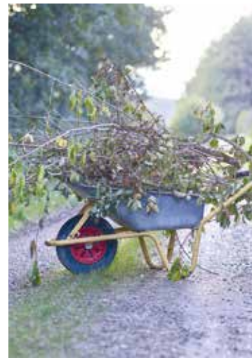
Grüngut aus dem Garten.