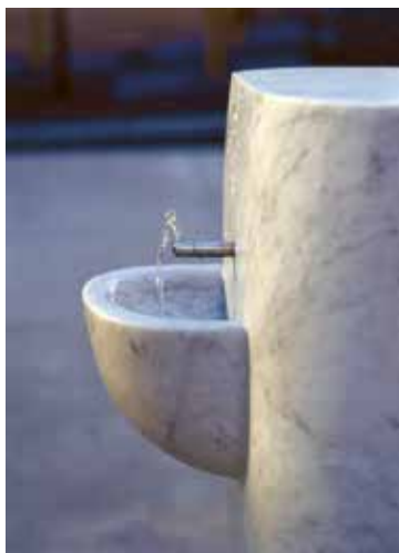
Trinkwasser, ein kostbares Gut.