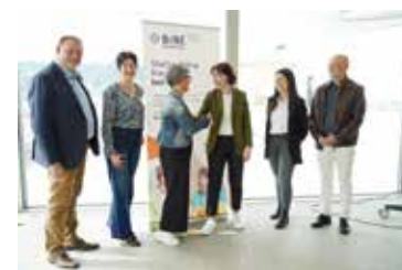
Übergabe der Leiterin Ausschuss an den Vereinsvorstand

Folgende Betriebe sind weiter im Netzwerk: Kloster Baldegg, Sonnenrain Rain, Dösselen Eschenbach.