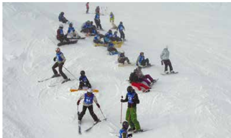
Skischule am Berg.