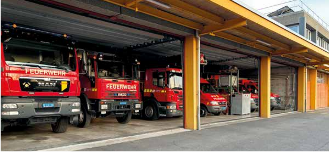
Mit der Erweiterung des Feuerwehrstützpunktes wird dringend benötigter Platz für die Einsatzfahrzeuge realisiert.