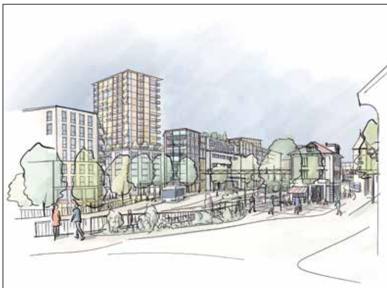
Blick vom Braukreisel auf das neue Südiareal. Volumenskizzen ohne Architektur.

Bereits zum dritten Mal konnte die Hochdorfer Bevölkerung Ende März bei der Entwicklung des Südiareals mitwirken. Die Reaktionen an zwei Infoveranstaltungen sowie in der anschliessend durchgeführten Onlineumfrage machen deutlich: Hochdorf ist auf dem richtigen Weg.