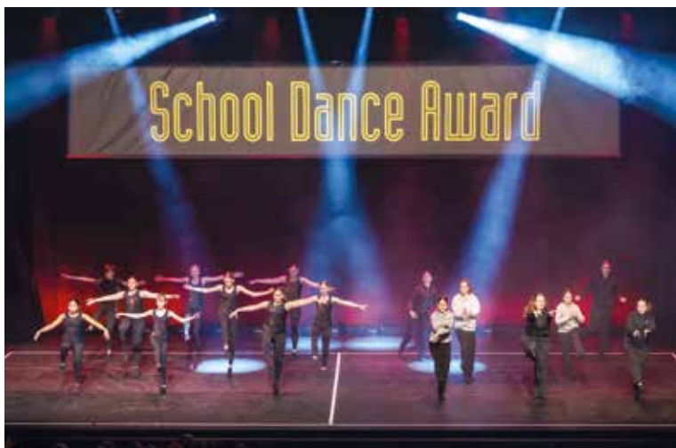
Bretter, die die Welt bedeuten.

Am Samstag, dem 29. März 2025, fand im Luzerner Saal des KKL-Luzern der 10. School Dance Award statt. Mit einer Rekordbeteiligung von 69 Teams und über 1'000 teilnehmenden Kindern und Jugendlichen war der Anlass ein voller Erfolg.