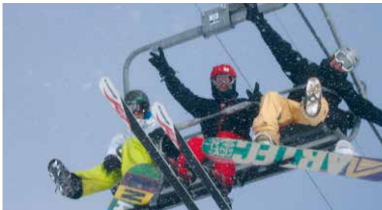
Fun auf dem Lift.

Während der ersten Ferienwoche der diesjährigen Faschnachtsferien fand das Wintersportlager der Schule Hochdorf in Disentis statt. Das Lager ist seit Jahren äusserst beliebt. Über 90 Kinder und Jugendliche machten sich auf den langen Weg ins Bündnerland, um bei guten Bedingungen Wintersport zu treiben. Einige standen sogar das erste Mal auf Ski oder Snowboard und lernten innerhalb kürzester Zeit, die Pisten herunterzufahren. Neben den täglichen Lektionen auf dem Snowboard bzw. Skis gehörten auch verschiedene Spiele und Aktivitäten zum vielfältigen Angebot. Abendspaziergänge, gemütliches Beisammensein am Lagerfeuer mit Marshmallows,