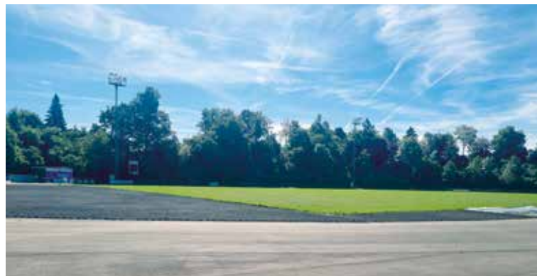
Sportanlage Arena Mai 2025.

Der Baustart erfolgte im Frühjahr 2024. Witterungsbedingt konnten die Arbeiten jedoch nicht wie geplant im selben Jahr abgeschlossen werden. Erst im April 2025 ermöglichten die Temperaturen und Wetterverhältnisse die Wiederaufnahme der Arbeiten. Das Rasenfeld wurde im April fertiggestellt und benötigt nun mehrere Monate zum Wachsen. Im Mai und Juni werden die finalen Arbeiten an der Rundbahn durchgeführt. Der FC Hochdorf wird in der Vorrunde Saison 25/26 noch auf den Kunstrasen