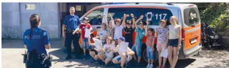
Besuch bei der Polizei, Ferienpass 2024.

Auch in diesem Jahr dürfen sich die Primarschülerinnen und Primarschüler aus Hochdorf und Römerswil auf abwechslungsreiche Sommerferien freuen: Der Ferienpass Seetal findet vom 7. bis 16. Juli 2025 statt und bietet eine Auswahl an spannenden Aktivitäten. In rund 40 Ateliers können die Kinder neue Hobbys entdecken, ihrer Kreativität freien Lauf lassen oder einfach gemeinsam mit Freunden eine tolle Zeit erleben. Das Angebot ist bunt und vielfältig – von Bastelstunden und spannenden Ausflügen bis hin zu Outdoor-Erlebnissen und sportlichen Akti-