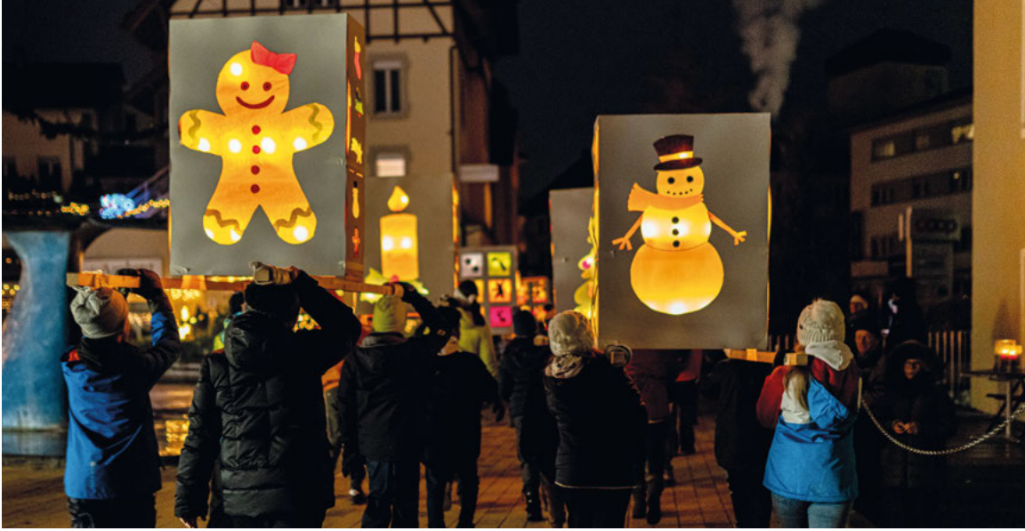
Samichlaus-Einzug - eine schöne Tradition in Hochdorf.