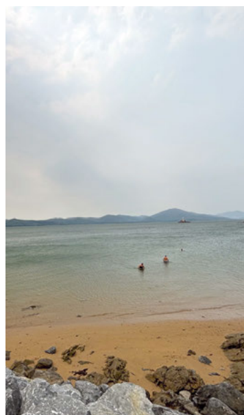
Fenit Beach, Irland.