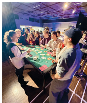
Casino- und Barbetrieb in der Aula.

Gestärkt durch das Dessert startete der offizielle Casino-Event und der Barbetrieb, bei welchem spannende Gespräche über dies und das stattfanden. Dass diese entspannte Feier Anklang fand, zeigte sich nicht zuletzt darin, dass sie bis zu später Stunde andauerte.