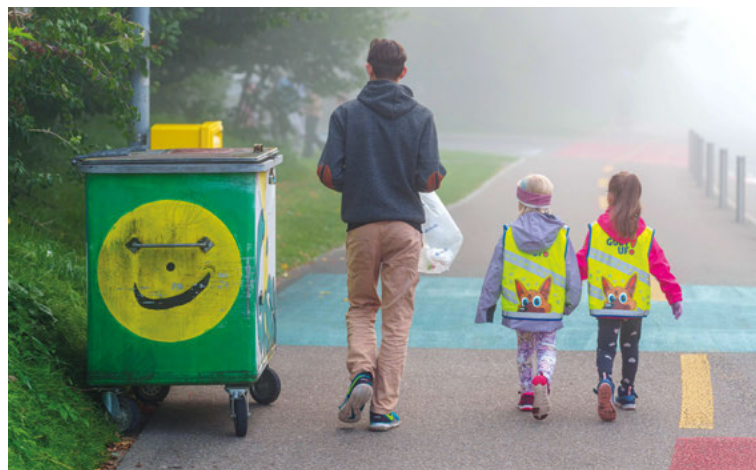
Zusammen unterwegs am CleanUpDay.

„Znüni«, bevor der Rest des Vormittags mit gemeinsamen Spielen verbracht wurde. Die fröhliche Stimmung zeigte deutlich: Umweltschutz kann auch Spass machen! Die Schule Hochdorf blickt auf einen gelungenen Tag