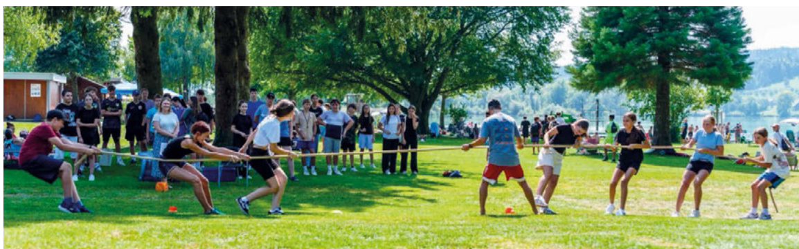
Mit ganzem Einsatz beim Seilziehen.