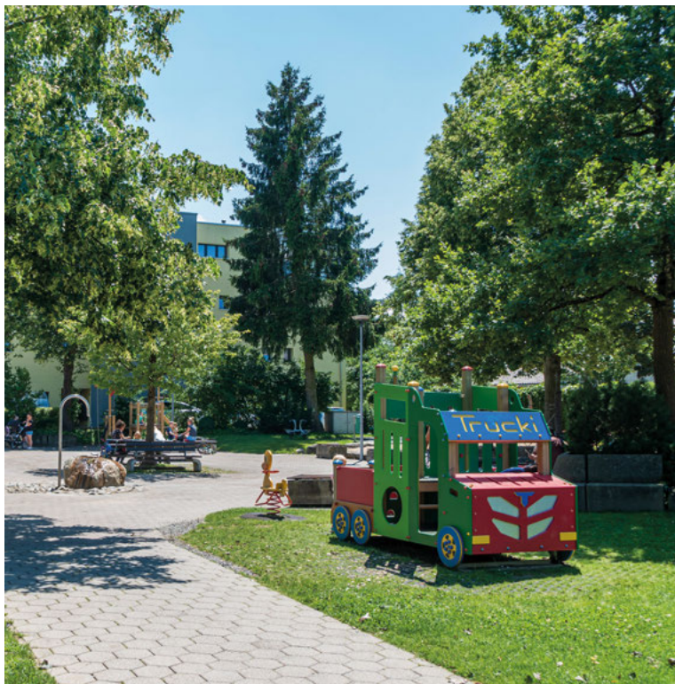
Beliebter Spielplatz Lunapark.