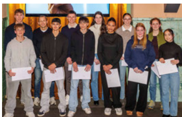
Geehrte Sportlerinnen und Sportler

Am 24. November 2025 ehrten die Gemeinde Hochdorf und die Sportkommission im Sudhuus die herausragenden sportlichen Leistungen der Hochdorfer SportlerInnen in den Jahren 2024 und 2025. Vertreter der Sportkommission moderierten durch den Abend und ermöglichten im Gespräch mit den SportlerInnen einen spannenden Einblick in die Sport- und Trainingserfahrungen der Geehrten. Nach dem offiziellen Teil gab es beim Apéro Zeit für Gespräche untereinander. Die Gemeinde Hochdorf übergab dieses