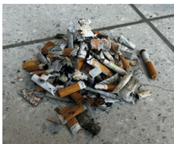
Zigarettenstummel, gesammelt vor dem Bezirksgericht.