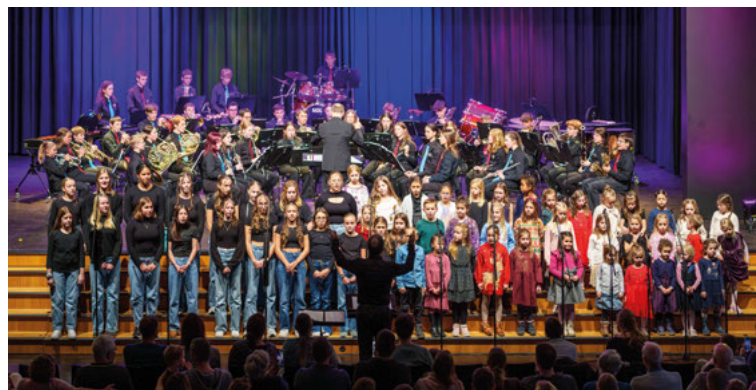
Stimmungsvolles Weihnachtskonzert der Jugendmusik und Chöre.

Im Rahmen des Anmeldeverfahrens für das Schuljahr 2026/27 finden am Dienstag, 10. März