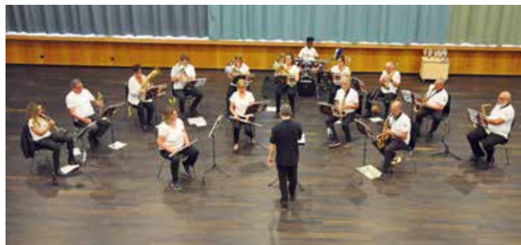
Die Bläserklasse Seetal am Konzert im Kulturzentrum Braui.

Im Sommer wird eine neue Bläserklasse eröffnet. Sie spricht alle Erwachsenen an, die neu ein Blasinstrument erlernen möchten. Die Bläserklasse ist auch für alle da, die sich den langersehnten Wunsch erfüllen wollen, die Kenntnisse auf dem eigenen, vor Jahren erlernten Instrument wieder aufzufrischen und zu erweitern. Alle nötigen Informationen zur Bläserklasse sind unter www.bläserklasse-seetal.ch zu finden. Dank der Zusammenarbeit mit der Harmonie Hochdorf und der Feldmusik Hochdorf sowie der Unterstützung der umliegenden Musikschulen und Musikvereine kann das Angebot Bläserklasse Seetal bestehen und erweitert werden. Eine Seetaler Erfolgsgeschichte.