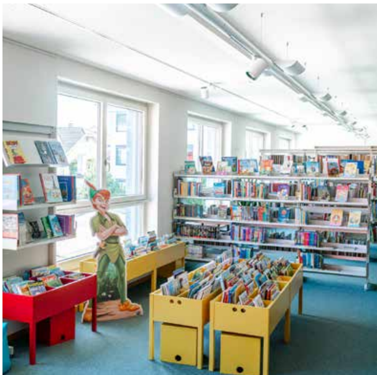
Kinderecke in der Regionalbibliothek.

Der vollständige Jahresbericht 2022 kann auf www.hochdorf.ch eingesehen werden.