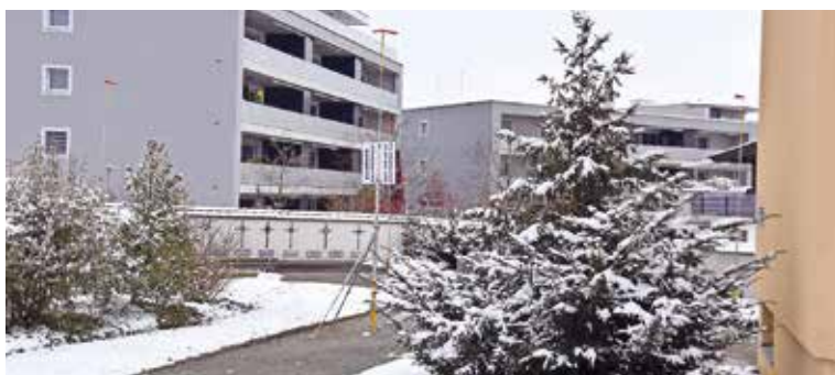
Standort der Aufbahrungs- und Abdankungshalle.

Die Baubewilligung für die Aufbahrungs- und Abdankungshalle im Friedhof 3 liegt vor. Somit kann das Projekt realisiert werden. Der Start der Bauarbeiten für die Aufbahrungs- und Abdankungshalle sind von Juni bis Ende Oktober 2023 vorgesehen. Parallel werden zu Baubeginn mit dem Baumeister die Tiefbauarbeiten für die Erschliessungsarbeiten für Wasser und Strom für den Neubau gemacht. Die Auf-