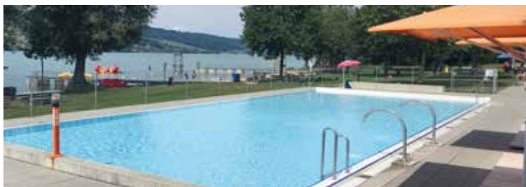
Das Seebad Baldegg öffnet Mitte Mai.

Wie gewohnt wird die Badesaison im Seebad Baldegg am «Muttertag» Mitte Mai eröffnet. Auf die kommende Saison hin wird ein neues, digitalisiertes Eintrittssystem eingeführt, welches wiederum den Bezug von Saisonkarten, 10-er Abonnements sowie Tageseintritten ermöglicht. Bestehende 10-er Abo's haben nach wie vor ihre Gültigkeit und berechtigen zum Eintritt. Die neuen Saisonkarten und Abo's können während der Öffnungszeiten im Restaurant bezogen werden. Peter Isenegger und