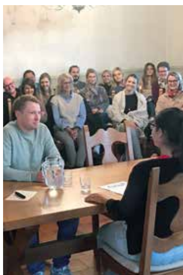
Schauspielerin im Gespräch mit einem Schulleiter.

Das Elterngespräch ist das wichtige Mittel, um Informationen mit den Erziehungsberechtigten auszutauschen (schulische Leistungen,