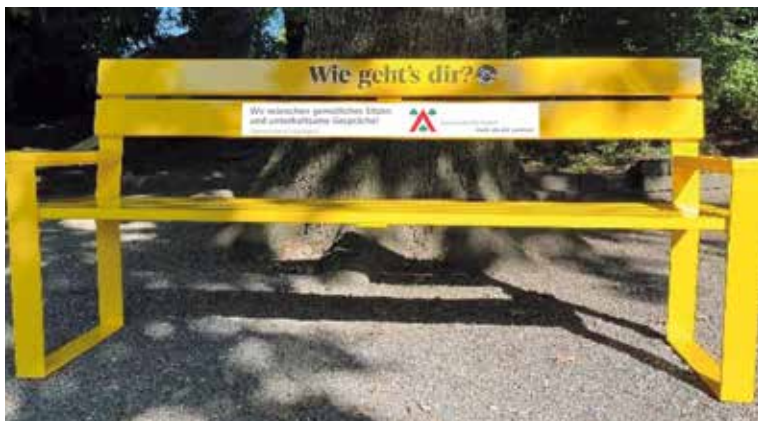
Einladende, gelbe Sitzbank.

In den nächsten Monaten zirkuliert ein gelbes «Wander-Bänkli» durch Hochdorf an verschiedenen Standorten und vor Geschäften.