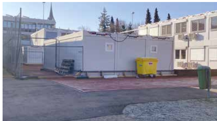
Sanierungsbedürftiger Sportplatz Avanti.

Mit der Fertigstellung der Sanierungsarbeiten am Schulhaus Avanti und des neuen Separatbaus der Tagesschule werden die provisorischen Modulbauten auf dem roten Sportplatz überflüssig. Diese werden kurz nach dem Umzug ins Schulhaus Avanti demontiert, damit dieser Platz wieder dem Sport zur Verfügung steht. Da sich der Platz aktuell in einem sehr schlechten Zustand befindet, wird dieser in den Fol-