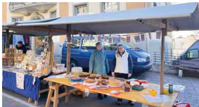
Impression vom Stand.

«Wir nehmen das Heft in die Hand und leisten einen Beitrag.» So in etwas dürfte sich dies das Elternforum Weid vorgenommen haben. Mit dem Kuchenverkauf am Herbstmarkt leistete das Elternforum diesen Beitrag. Ein riesiges «Arsenal» an feinen Kuchen präsentierte sich den Besucherinnen und Besuchern am Stand. Und die leckeren Gebäcke kamen sehr gut an und wurden