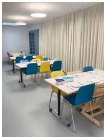
Nische beim Mittagstisch der neuen Tagesschule.

Das Betreuungsangebot der Tagesstrukturen und der Umzug der SEK-Klassen stehen ebenfalls kurz vor der Umsetzung. Das Umzugsdatum für das SEK-Schulhaus ist für den 23./24. März 2023 geplant. Somit wird der Unterricht bereits in der letzten Märzwoche im «neuen» Schulhaus stattfinden. Selbstverständlich werden wir die neuen Anlagen auch der Öffentlichkeit zugänglich machen. Die Eröffnungsfest findet am Freitag, 23. Juni 2023 statt. Details dazu werden folgen.