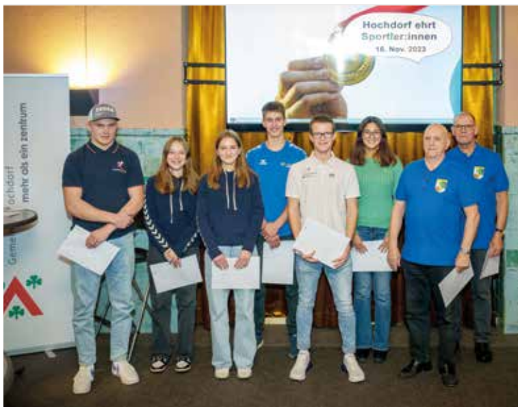
Geehrte Sportlerinnen und Sportler.