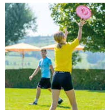
Spiel und Spass.