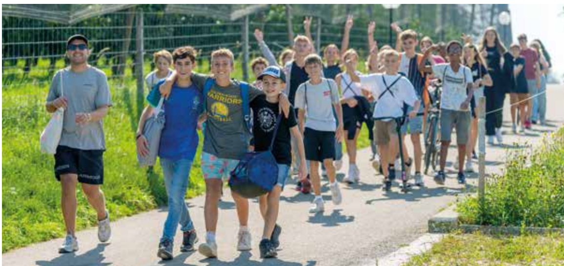
Zu Fuss auf dem Weg in die Badi.

Anlässe für die gesamte Sekundarschule wie z.B. «Meet & Move» haben an unserer Schule einen grossen Stellenwert. Wenn man sich kennt, sucht man den Kontakt zueinander und fühlt sich als eine Gemeinschaft. Mögliche Ausgrenzungen und Konflikte zwischen unterschiedlichen Gruppen können somit stark reduziert, wenn nicht sogar vermieden werden.