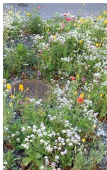
Aufwertung durch Bäume und Rabatten.

Wie im Artikel Mobilitätsstrategie festgehalten (S.2), steht im Strassenraum eine gesamtheitliche Betrachtung im Fokus. Die zu Fuss Gehenden, die Velofahrenden, der motorisierte Verkehr aber auch die Personen, die sich im Strassenraum aufhalten, stehen im Fokus. Mit der zunehmenden Klimaveränderung werden Massnahmen wie das Anpflanzen von Bäumen, Rabatten, Sträuchern im Rahmen von