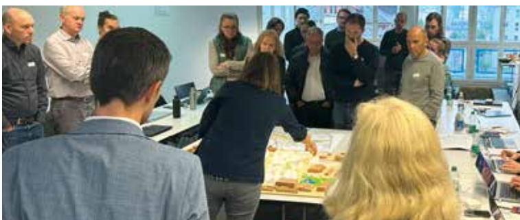
Projektpräsentation vor dem Beurteilungsgremium und den weiteren Teams.

Seit Mitte Juni beschäftigen sich drei interdisziplinäre Planerteams mit der Frage, wie man der Vision «Südiareal – Hofdere zentral» am besten gerecht wird: Welche Bebauungsstruktur nutzt die topographische Lage optimal? Wie werden im Rahmen des Mobilitätshubs die Bushaltestellen angeordnet? Wo entstehen Begegnungsorte für Hochdorf und wie werden diese von Anfang an belebt? Die Vielschichtigkeit dieser Fragen stellt selbst für die erfahrenen Fachleute eine echte Herausforderung dar. Nicht alle Ziele harmonieren miteinander, auch wenn sie – isoliert betrachtet –