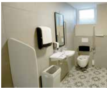
Sanitäre Anlage im UG.

Mit der Sanierung der sanitären Anlagen im Untergeschoss sind die Renovationsarbeiten und die Umgestaltung im Rathaus soweit abgeschlossen. Zu Beginn des neuen Jahres wird der Personenlift an die Normen des hindernisfreien Zugangs angepasst. Am