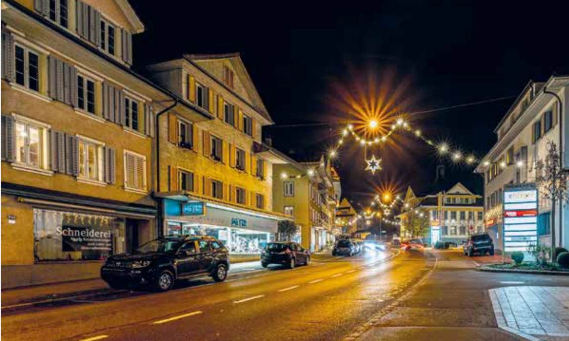
Das Dorfzentrum von Hochdorf im warmen Licht der traditionellen Weihnachtsbeleuchtung.