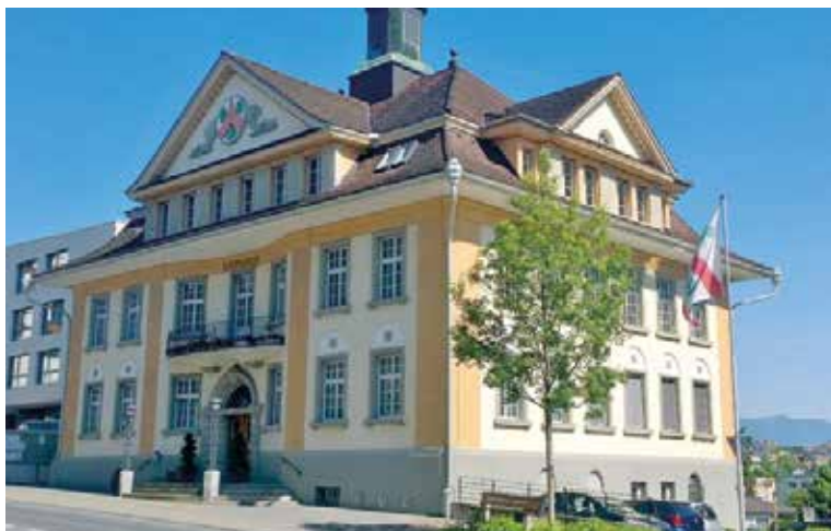
Die Gemeindeverwaltung mit Sitz im Rathaus.

Im Alltag des Ressorts Bau, Verkehr und Umwelt zeigt sich, dass das Erfüllen der gesetzlichen Vorgaben und der betrieblichen Leistungsaufträge mit den vorhandenen personellen Ressourcen eine Herausforderung ist. Mit dem Ziel, die Abläufe und Prozesse zu optimieren, hat der Gemeinderat eine externe Organisationsanalyse im Ressort Bau, Verkehr und Umwelt durchgeführt. Daraus resultierend hat der Gemeinderat die künftige Zielorganisation festgelegt. Als Folge davon wird die Bereichsleitung neu organisiert. Der bisherige Stellen-