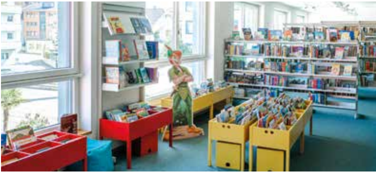
Kinderecke in der Bibliothek.

Vor 50 Jahren, am 7. März 1974, wurde die erste Regionalbibliothek des Kantons Luzern in den neuen Räumlichkeiten der Kantonschule Hochdorf an der Sagenbachstrasse eröffnet. 1997 war der nächste grosse Schritt: die Regionalbibliothek konnte neue Räumlichkeiten im Kulturzentrum Braui – mitten im Zentrum von Hochdorf – beziehen. Am Freitag, 1. März 2024, 20.00 Uhr wird im Brauturm das